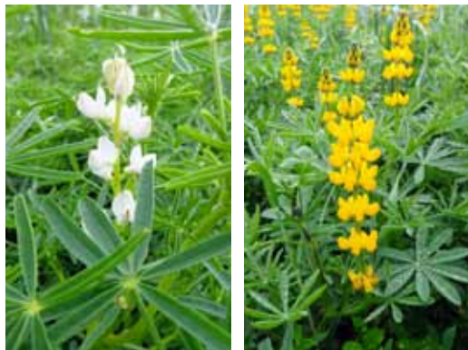
Både forgrenet smalbladet lupin og gul lupin har god ukrudtskonkurrenceevne, men udbyttet i gul lupin er væsentligt lavere end i smalbladet lupin.