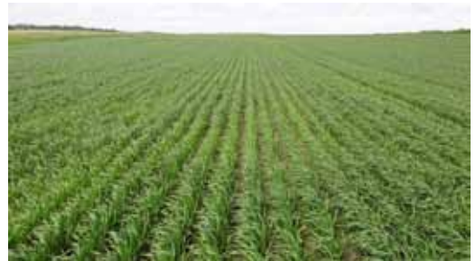
Vårhvede, dyrket på 25 cm rækkeafstand og radrenset.

I to af forsøgene indgår der et tredje forsøgsled i faktor 2 ud over to gødningsniveauer ved normal rækkeafstand. Det er dyrkning på 25 cm rækkeafstand og radrensning ved det lave gødningsniveau. Ved en fejl er dette forsøgsled ikke blindharvet i det ene forsøg, ligesom de to forsøgsled sået på almindelig rækkeafstand. Det har medført et meget højt antal ukrudtsplanter efter fremspiring. Alligevel har radrensningen resulteret i lavere ukrudtsdækning ved høst. Der har ikke været signifikant forskel på udbyttet som følge af rækkeafstand og ukrudtsbekæmpelse.