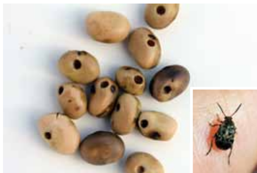
Hestebønner med gnav af hestebønnebiller og nærbillede af hestebønnebille.