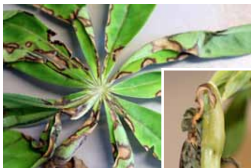
Gul lupin angribes af svampesygdommen Anthracnose. (Fotos: Ghita Cordsen Nielsen, Videncentret for Landbrug).

ved de forgrenede lupiner er, at de har en større tendens til lejesæd og modner sent og uensartet. Tendensen til lejesæd i Azuro og Iris er reduceret ved iblanding af vårhvede, ligesom det for alle sorter har resulteret i et lavere vandindhold.